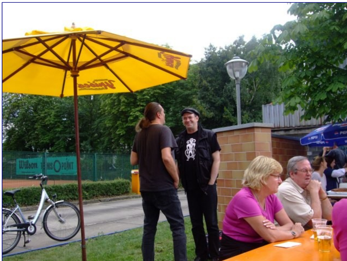
Die Barden vorm Auftritt