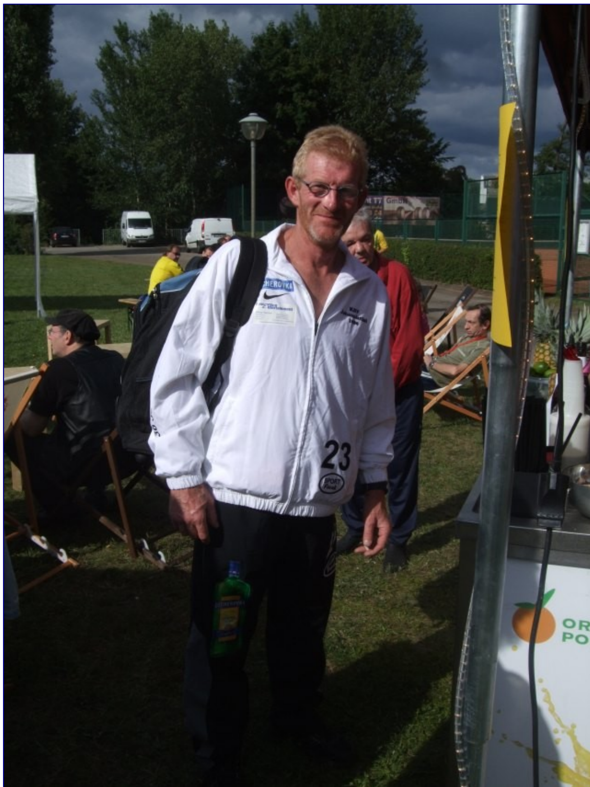
Das KSV Leibchen nun auch auswärts unterwegs