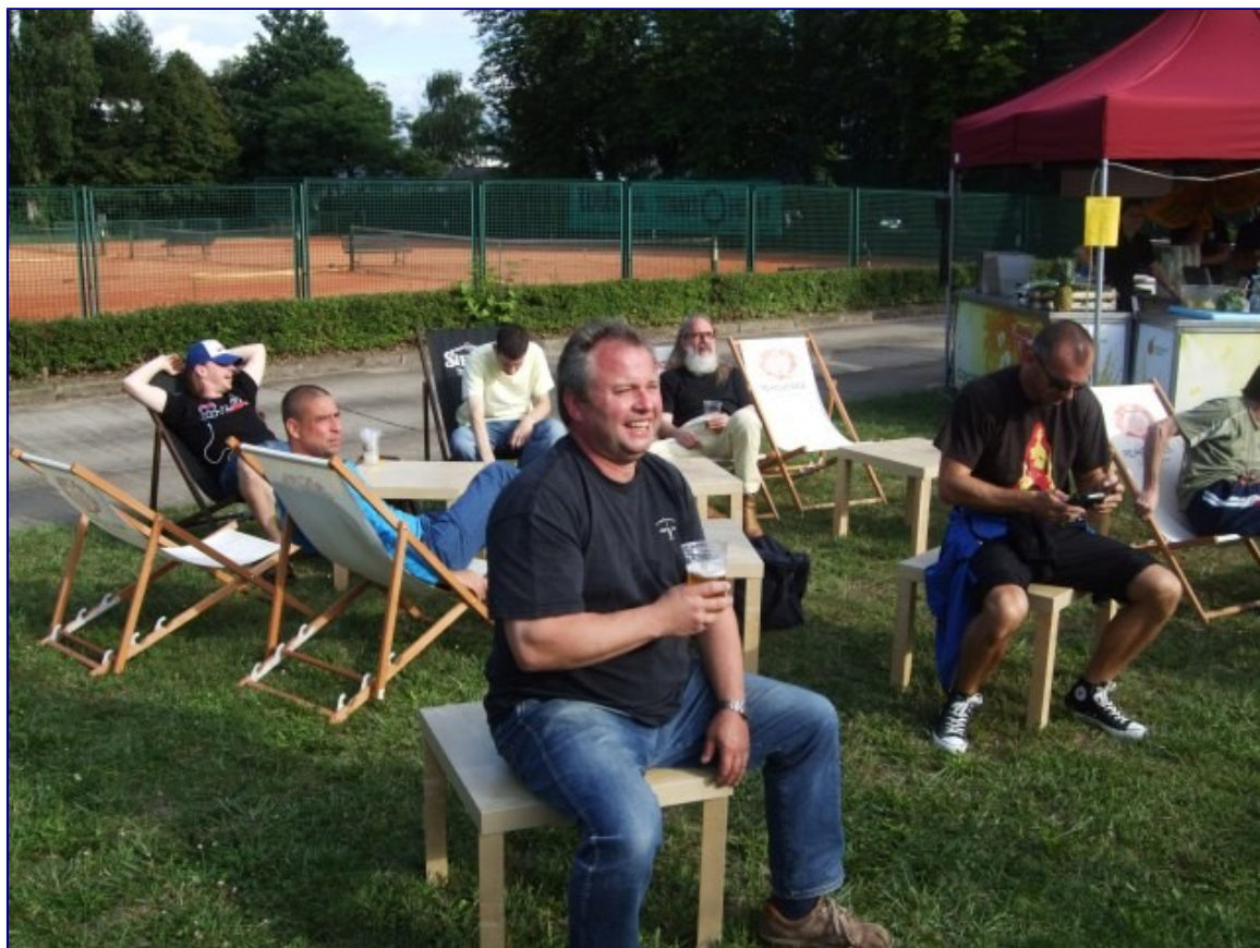
Justus: Nach getaner Arbeit macht's doppelt Spaß