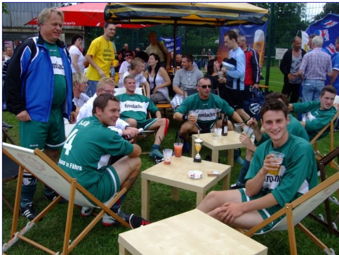
Gruppo infernale. Die Hamburger Jungs