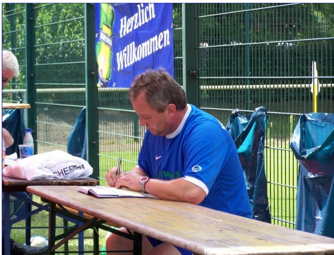
Der Kassenwart. Stets fleißig im Dienste des KSV!