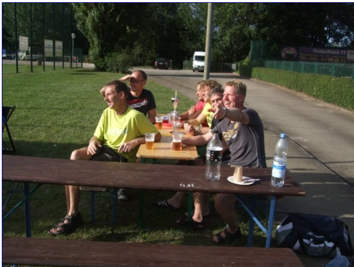
Super Gäste. Die Heiligenstädter