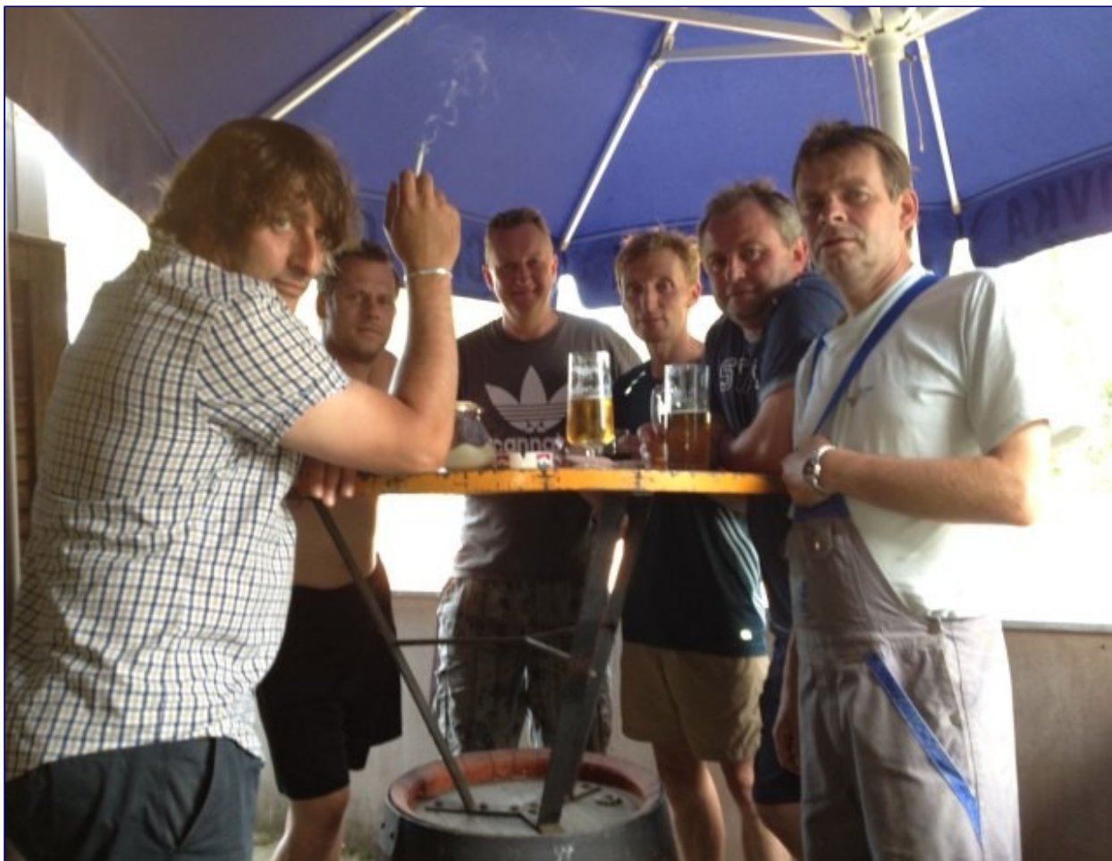
Die Pokalhelden in vollständiger Aufstellung

Aus gegebenem Anlass und wegen ihres herausragenden Einsatzes heben wir zwei Helden der ‘heißen Pokalschlacht’ hervor: