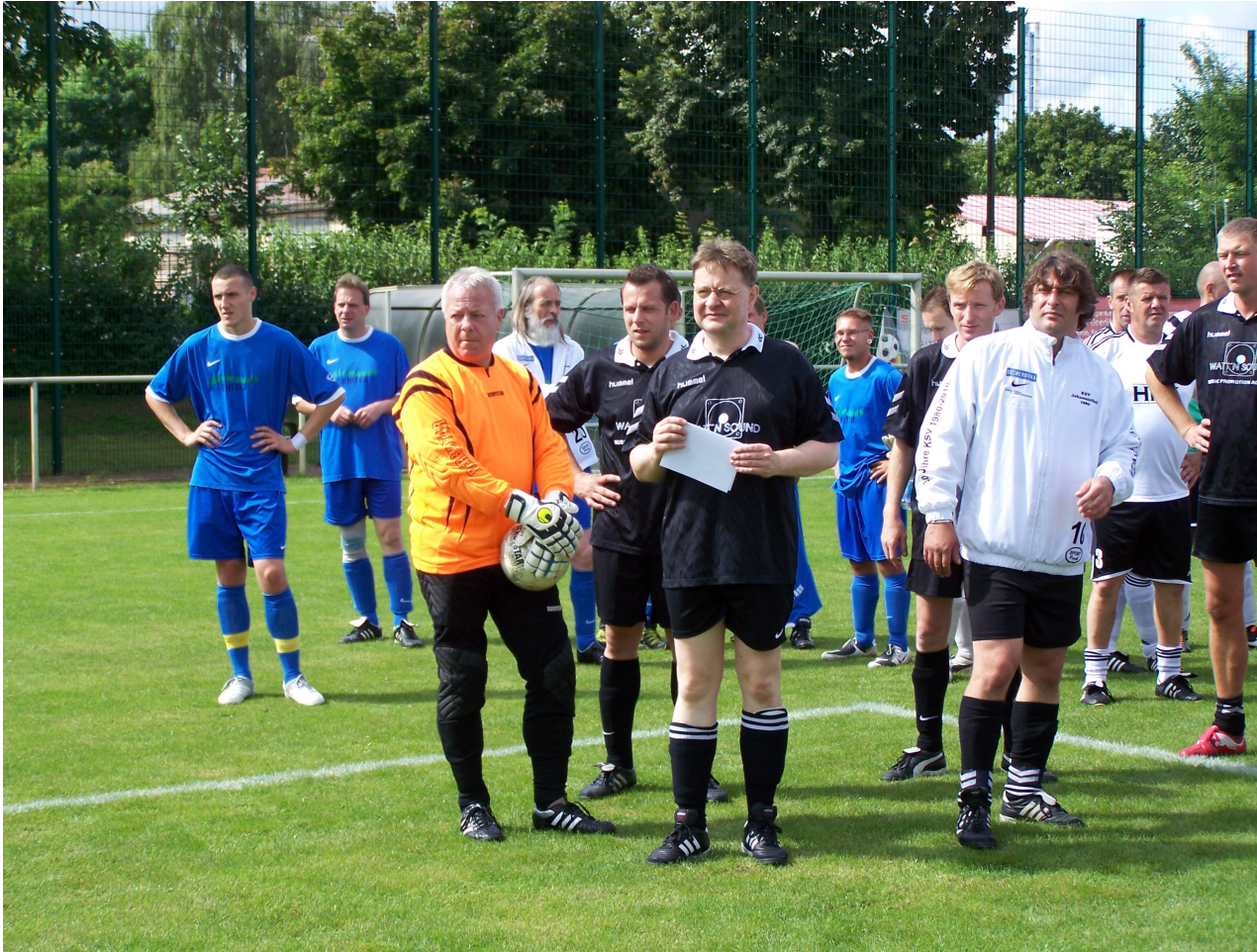
Der KSV beim Mauerfallcup im August 2012: Noch skeptisch, aber im Nachhinein war's ein voller Erfolg.