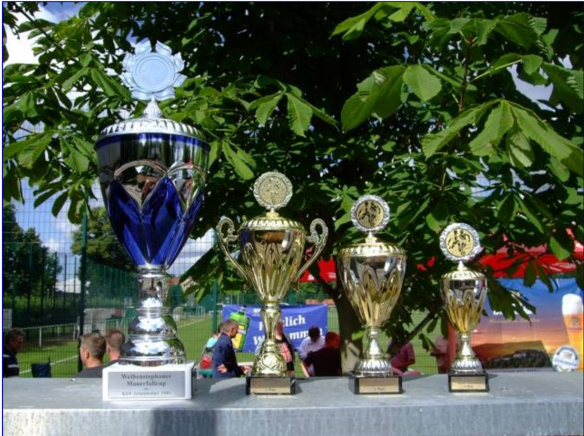
Objekte der Begierde