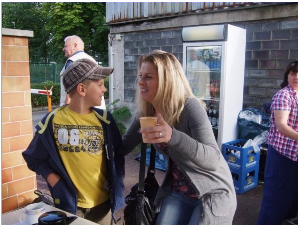
Viel schöner als immer nur den Schröder auf'm Bild