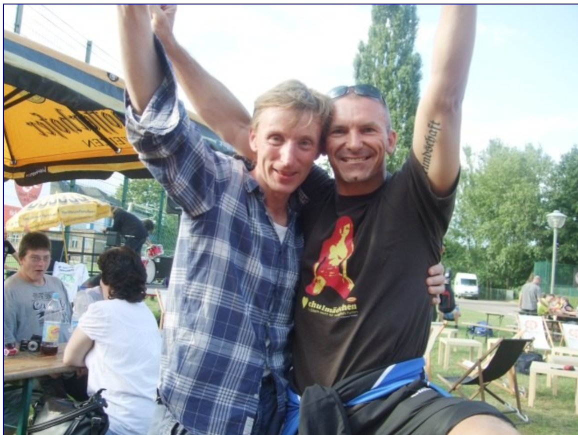
'Torjäger' unter sich: Rooney und der vom KSV ...