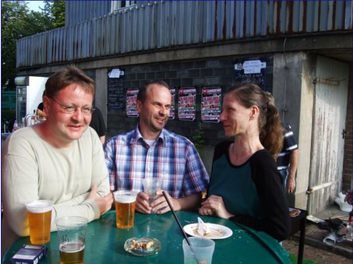
Gastspieler in bevorzugter Behandlung