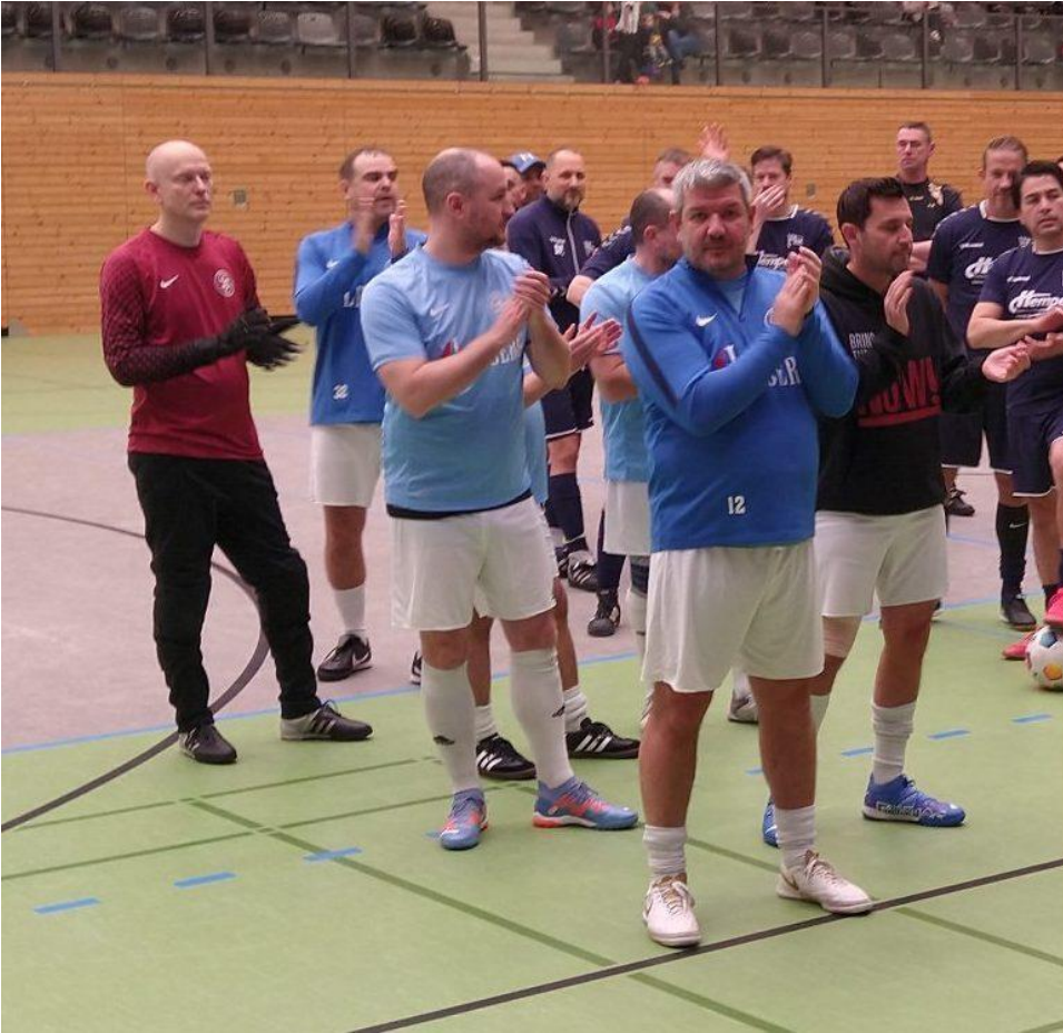
Makkabi, wenigstens teilweise