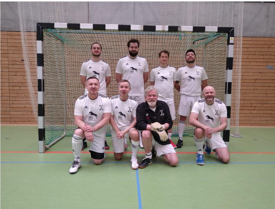
Seriensieger X Kickers. Diesmal musste der vorletzte Platz reichen