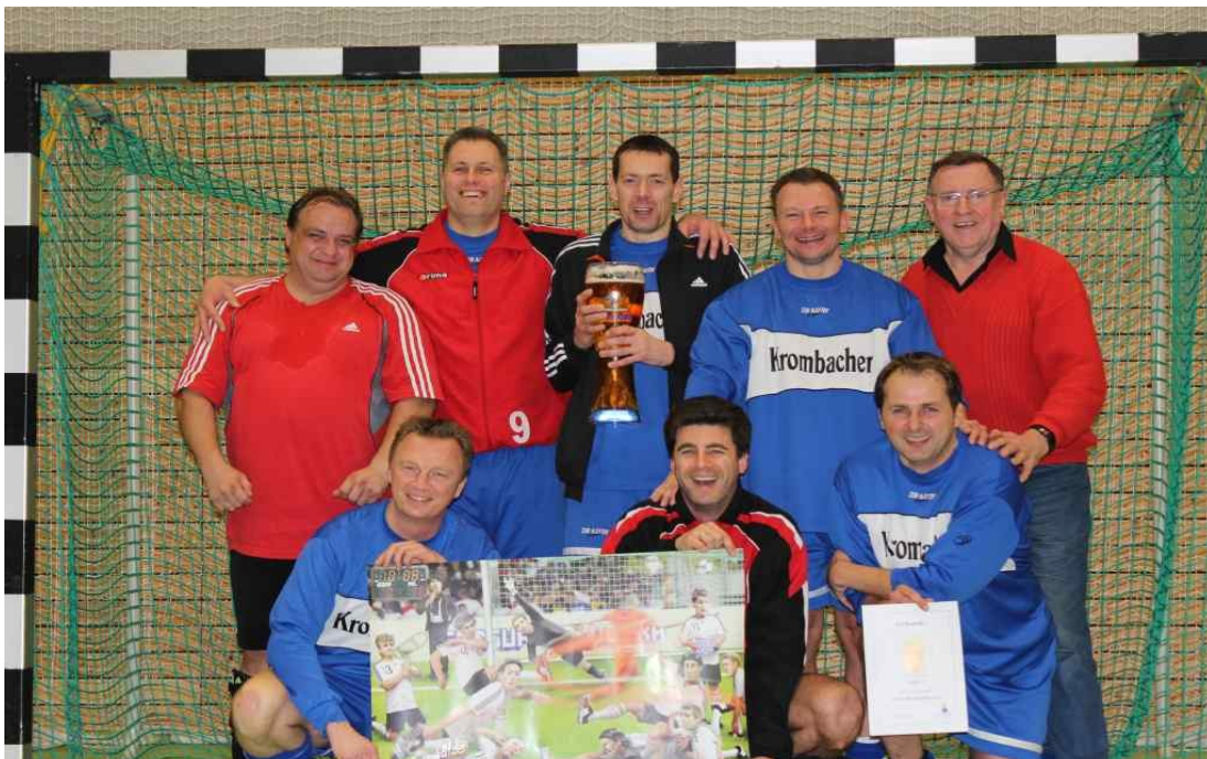
Die Sieger aus Lichtenrade