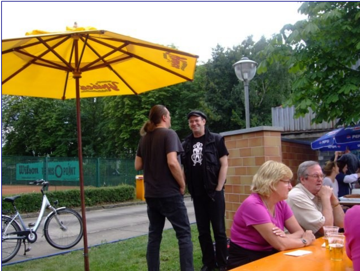
Die Barden vorm Auftritt