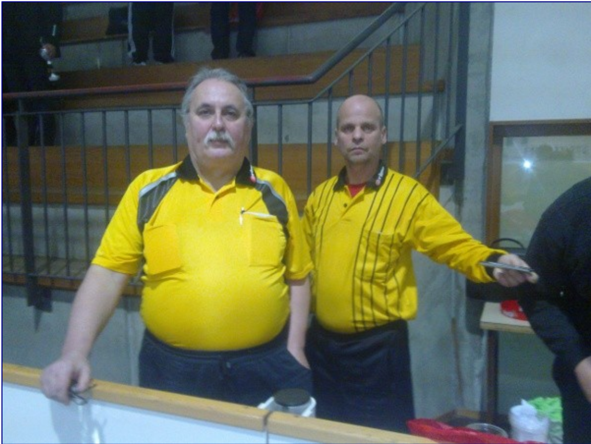
Und ohne die geht es nicht, das treue Schirigespann