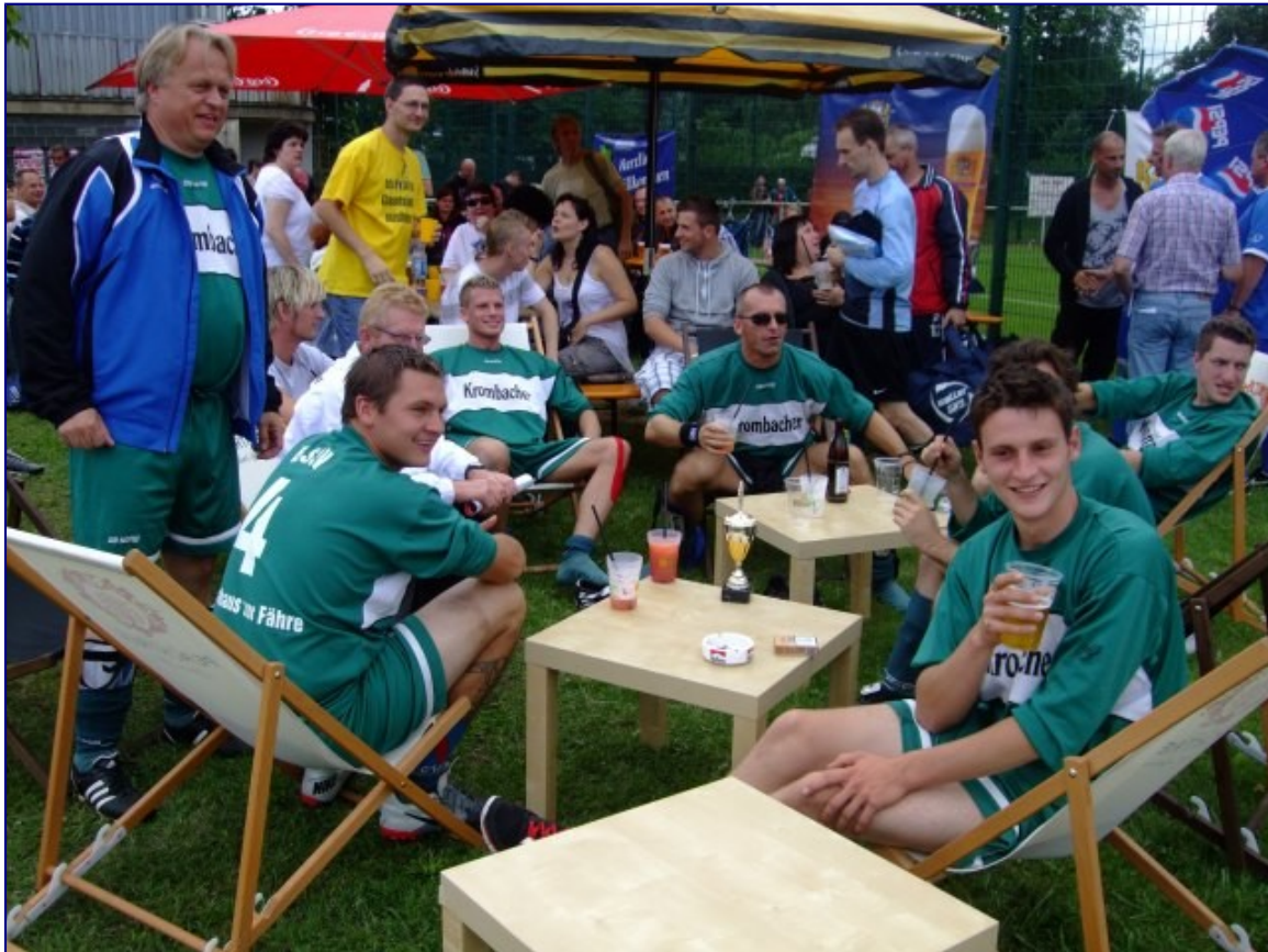
Gruppo infernale. Die Hamburger Jungs