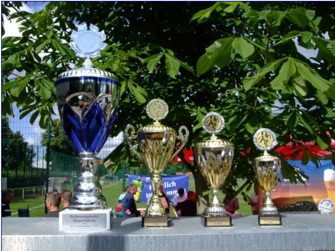
Objekte der Begierde