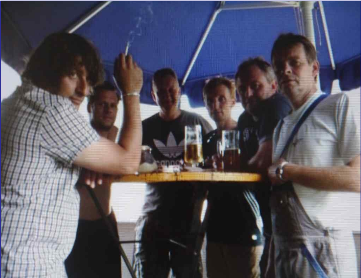
Die Pokalhelden in vollständiger Aufstellung

Aus gegebenem Anlass und wegen ihres herausragenden Einsatzes heben wir zwei Helden der ‘heißen Pokalschlacht’ hervor: