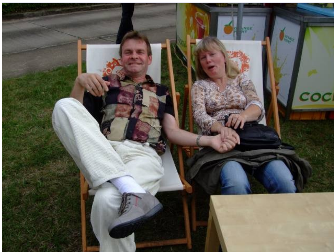
Is det scheen beim KSV