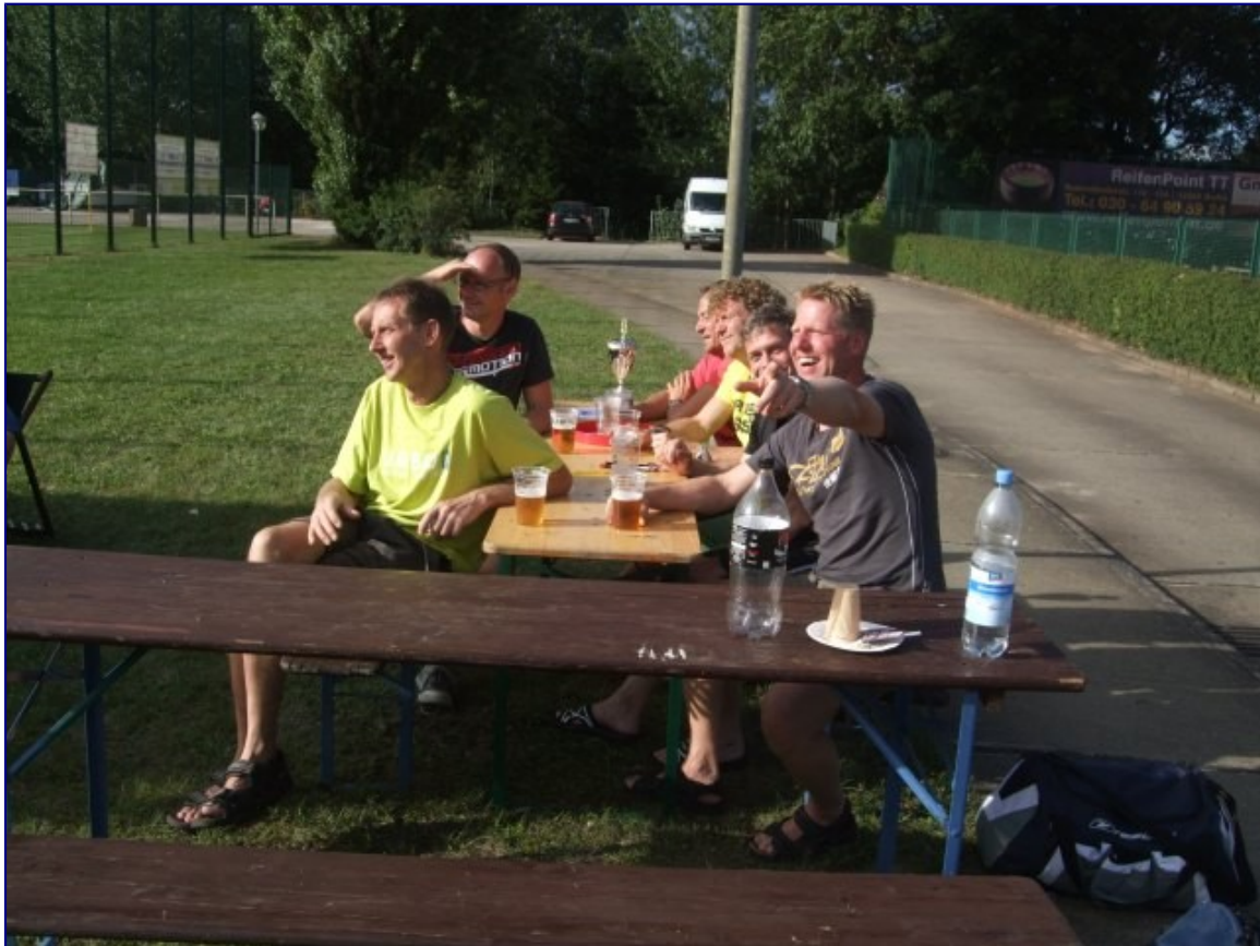
Super Gäste. Die Heiligenstädter