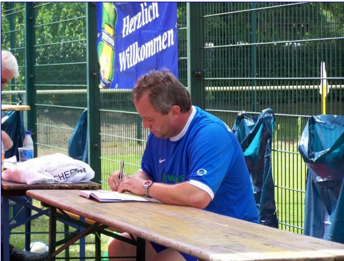
Der Kassenwart. Stets fleißig im Dienste des KSV!