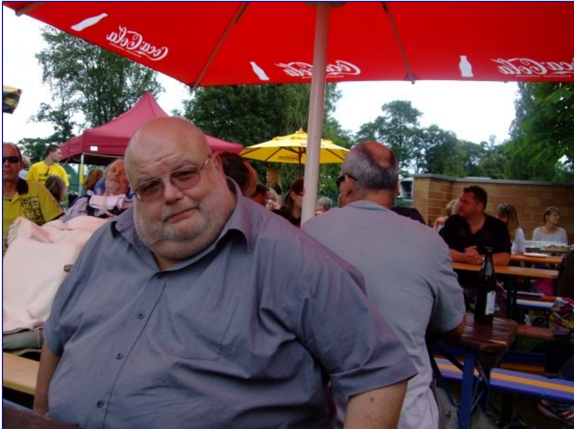
Der 'Greuliche' gewohnt souverän