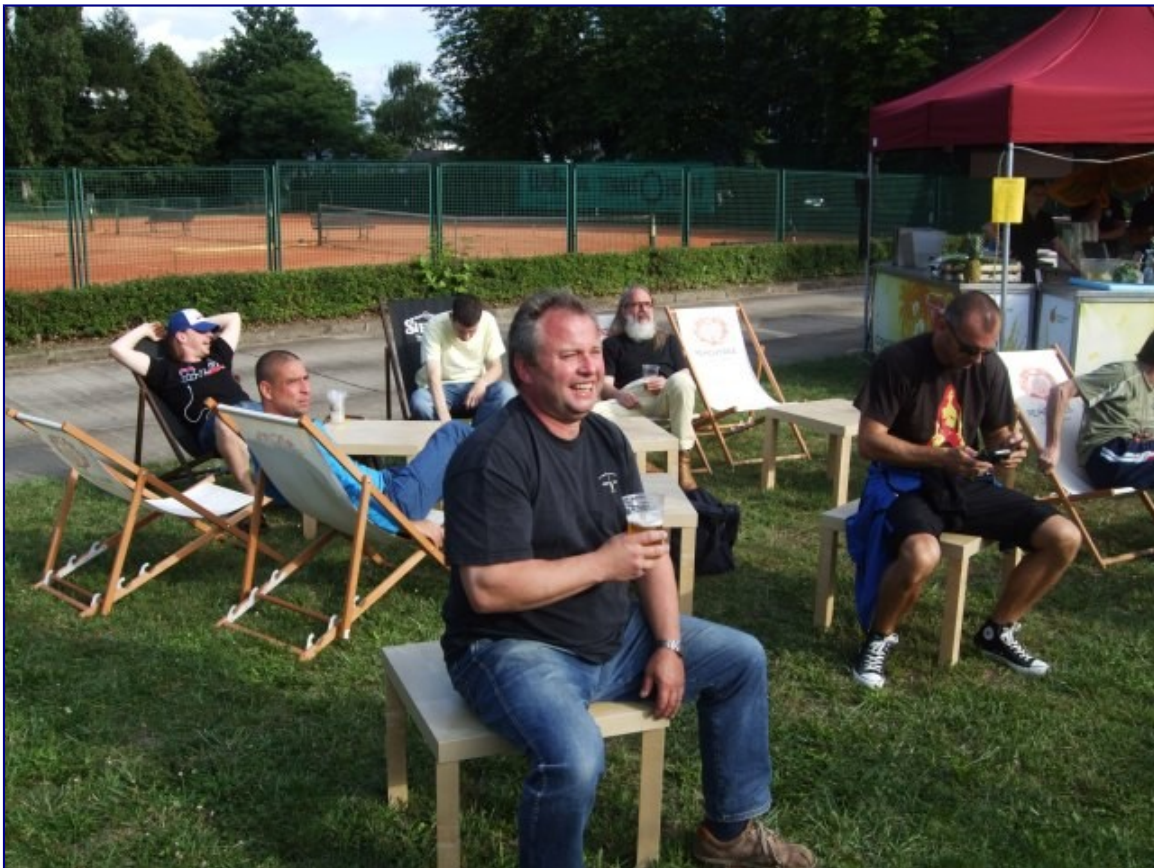
Justus: Nach getaner Arbeit macht's doppelt Spaß