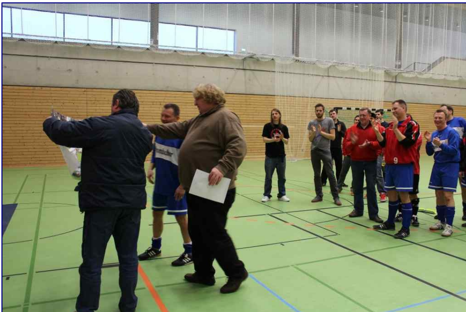
Lichtenrade saht ab