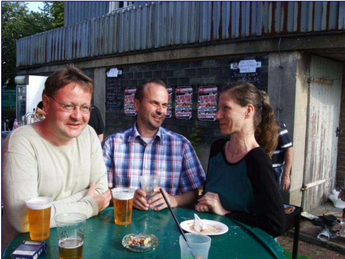
Gastspieler in bevorzugter Behandlung