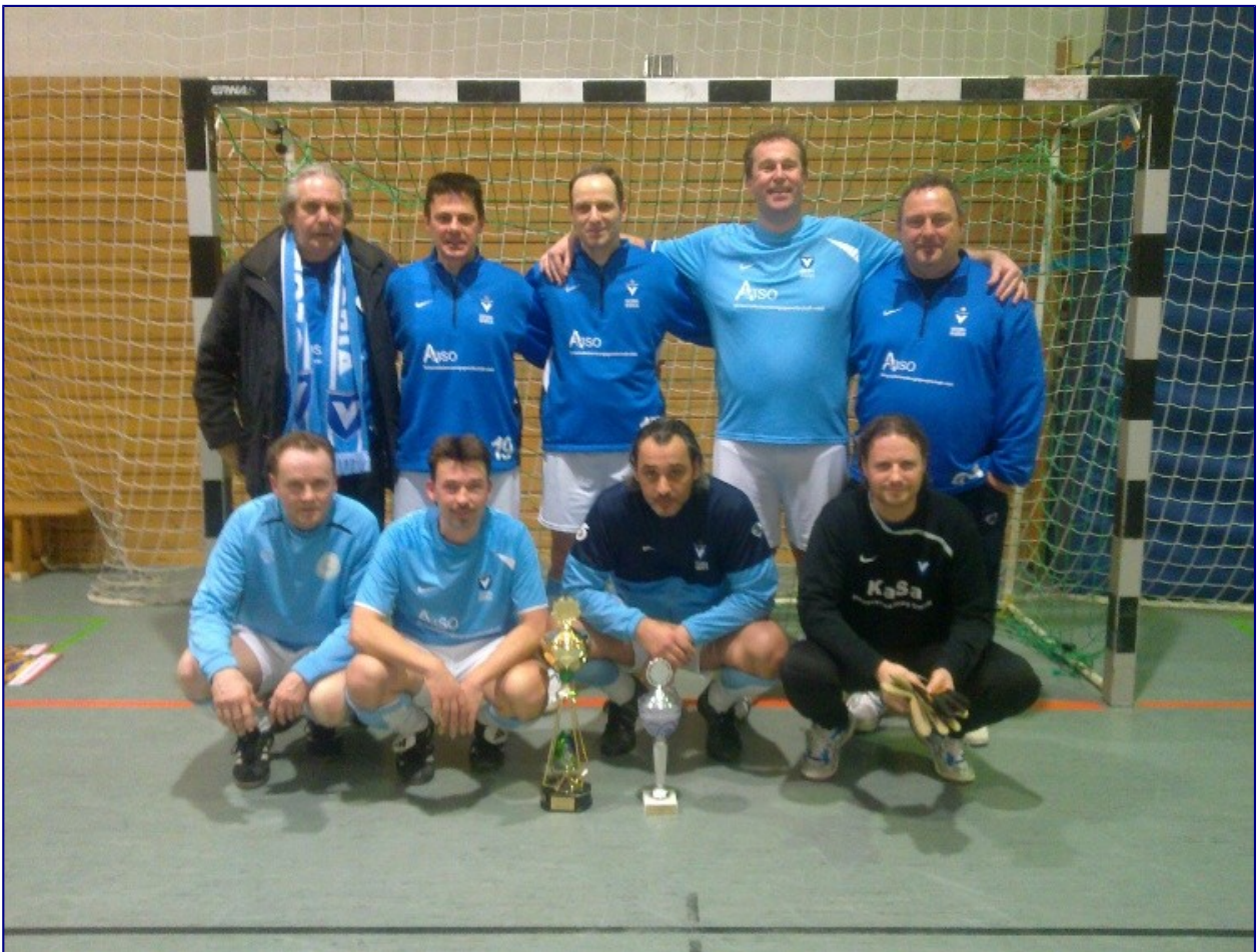
Stolze Sieger des Turniers, die Mannschaft von Viktoria 89