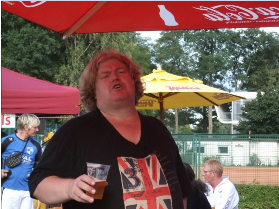
Der Präsident, ausgelassen...