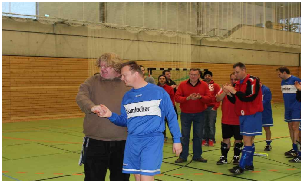
Und wieder Lichtenrade