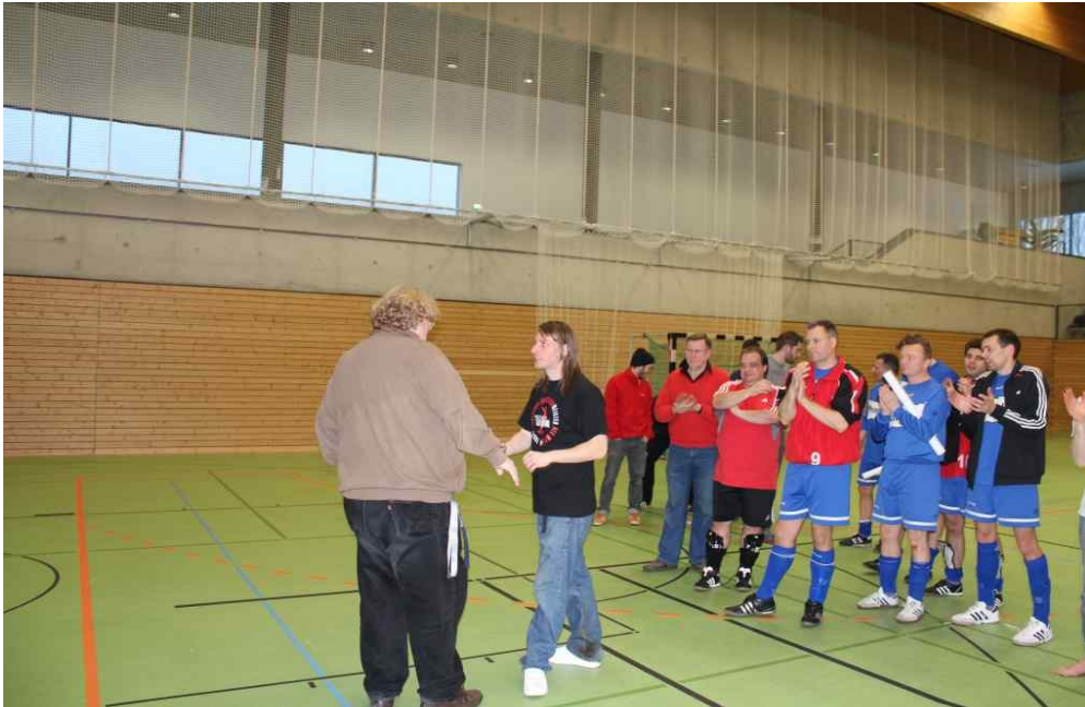
Hollywood leider ohne großen Ruhm