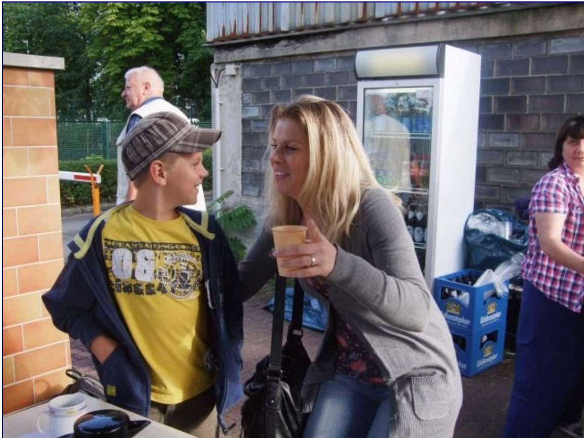
Viel schöner als immer nur den Schröder auf'm Bild